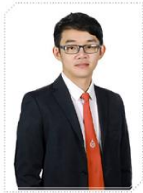
๑๕. คณะทำงาน และเลขานุการ มหาวิทยาลัยวลัยลักษณ์