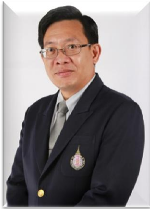
๑. ประธานคณะกรรมการ มหาวิทยาลัยวลัยลักษณ์