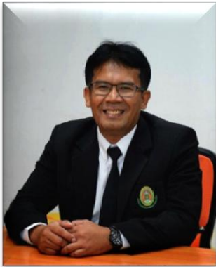
๕. คณะทำงาน มหาวิทยาลัยราชภัฏนครศรีธรรมราช