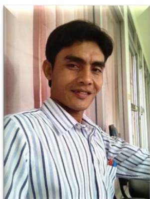
๑๒. คณะทำงาน มหาวิทยาลัยเทคโนโลยีราชมงคลศรีวิชัย วิทยาเขตนครศรีธรรมราช (ขนอม)