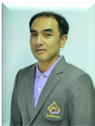
๑๕. คณะทำงาน วิทยาลัยชุมชนระนอง