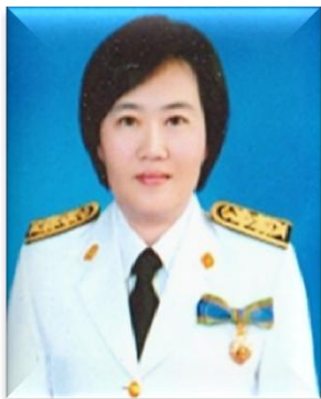
๖. คณะทำงาน มหาวิทยาลัยเทคโนโลยีราชมงคลศรีวิชัย วิทยาเขตนครศรีธรรมราช (ไสใหญ่)