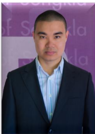
๓. คณะทำงาน มหาวิทยาลัยสงขลานครินทร์ วิทยาเขตสุราษฎร์ธานี