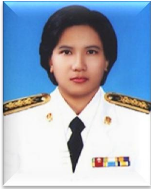
๗. คณะทำงาน มหาวิทยาลัยเทคโนโลยีราชมงคลศรีวิชัย วิทยาเขตตรัง