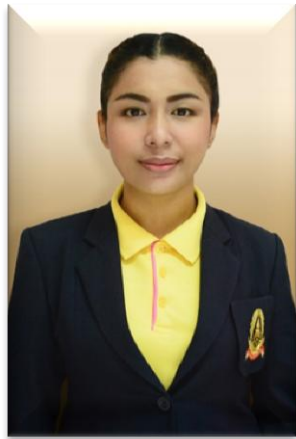
๘. คณะทำงาน วิทยาลัยเทคโนโลยีภาคใต้