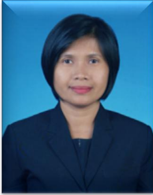
๔. คณะทำงาน มหาวิทยาลัยสงขลานครินทร์ วิทยาเขตตรัง