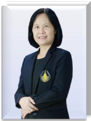
๒. คณะทำงาน มหาวิทยาลัยสงขลานครินทร์ วิทยาเขตภูเก็ต