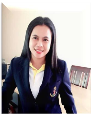
๙. คณะทำงาน มหาวิทยาลัยตาปี