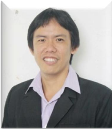
๑๓. คณะทำงาน มหาวิทยาลัยเทคโนโลยีราชมงคลศรีวิชัย วิทยาเขตนครศรีธรรมราช (ทุ่งใหญ่)