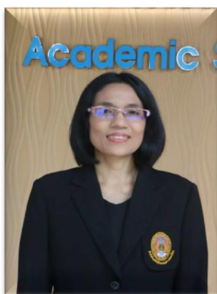
๑๑. คณะทำงาน มหาวิทยาลัยราชภัฏสุราษฎร์ธานี