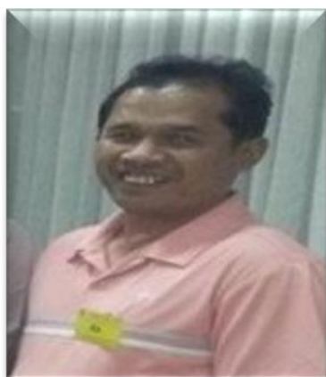
๑๔. คณะทำงาน วิทยาลัยชุมชนพังงา