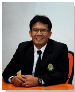
๕. คณะทำงาน มหาวิทยาลัยราชภัฏนครศรีธรรมราช