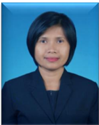
๔. คณะทำงาน มหาวิทยาลัยสงขลานครินทร์ วิทยาเขตตรัง