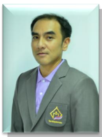
๑๕. คณะทำงาน วิทยาลัยชุมชนระนอง