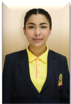
๘. คณะทำงาน วิทยาลัยเทคโนโลยีภาคใต้