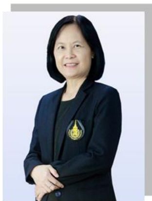
๒. คณะทำงาน มหาวิทยาลัยสงขลานครินทร์วิทยาเขตภูเก็ต