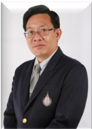
๑. ประธานคณะกรรมการ มหาวิทยาลัยวลัยลักษณ์