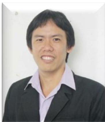
๑๓. คณะทำงาน มหาวิทยาลัยเทคโนโลยีราชมงคลศรีวิชัย วิทยาเขตนครศรีธรรมราช (ทุ่งใหญ่)