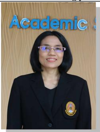
๑๑. คณะทำงาน มหาวิทยาลัยราชภัฏสุราษฎร์ธานี