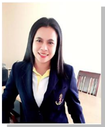
๙. คณะทำงาน มหาวิทยาลัยตาปี