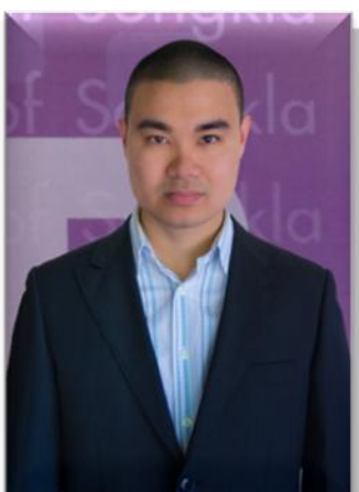
๓. คณะทำงาน มหาวิทยาลัยสงขลานครินทร์ วิทยาเขตสุราษฎร์ธานี