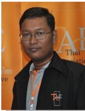
๑๖. คณะทำงานและเลขานุการ มหาวิทยาลัยวลัยลักษณ์