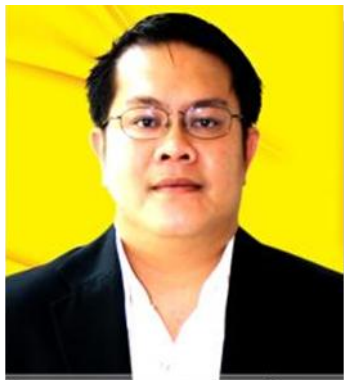
๑๐. คณะทำงาน มหาวิทยาลัยราชภัฏภูเก็ต