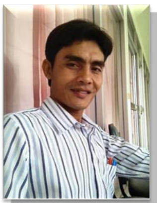
๑๒. คณะทำงาน มหาวิทยาลัยเทคโนโลยีราชมงคลศรีวิชัย วิทยาเขตนครศรีธรรมราช (ขนอม)