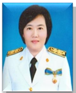
๖. คณะทำงาน มหาวิทยาลัยเทคโนโลยีราชมงคลศรีวิชัย วิทยาเขตนครศรีธรรมราช (ไสใหญ่)