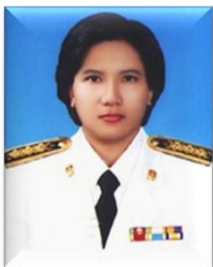
๗. คณะทำงาน มหาวิทยาลัยเทคโนโลยีราชมงคลศรีวิชัย วิทยาเขตตรัง